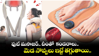
పుట్ మసాజర్, టింతో కందరాలు.. మెడ నొప్పులు ఇట్టే తగ్గుతాయి..

పుట్ మసాజర్.. టింతో కందరాలు.. మెడ నొప్పులు ఇట్టే తగ్గుతాయి..