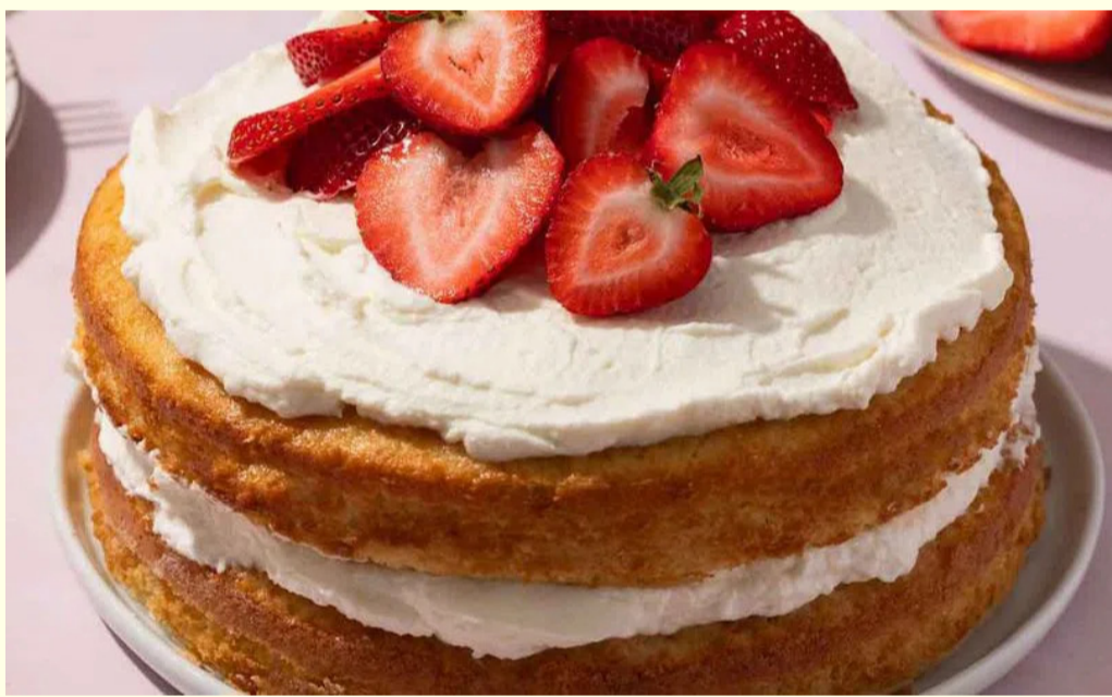
మరోవైపు నాన్-డెయిరీ క్రీమ్ పూర్తిగా వేరే ఉత్పత్తి. ఇది సాధారణంగా నీరు, హైడ్రోజనెటెడ్ వెజిటబుల్ ఆయిల్, కార్న్ సిరప్, స్టెబిలైజర్స్, ఎమల్సిఫైయర్స్ వంటి పదార్థాలతో తయారవుతుంది. ఇది డెయిరీ

పిల్లలతో పాటు పెద్దలు కూడా ఇప్పుడు తినే వాటిలో కేక్ ఒకటి. ప్రతి శుభకార్యంలో ఇప్పుడు కేక్ కట్టింగ్ తప్పనిసరిగా చేస్తున్నారు. అయితే కేక్ పై ఉండే క్రీమ్ నిజమైన డెయిరీ క్రీమ్, లేక నాన్-డెయిరీ క్రీమ్ అనే సందేహం చాలా మందికి వస్తుంటుంది. బయటకు చూస్తే రెండూ ఒకేలా కనిపించినా, రుచి, టెక్స్చర్, తయారీ విధానం వరంగా ఇవి పూర్తిగా భిన్నమని పుణ్య నిపుణులు చెబుతున్నారు. ముఖ్యంగా భారతీయ టేకరిల్లో ఎక్కువగా ఉపయోగించే నాన్-డెయిరీ క్రీమ్ గురించి తెలుసుకోవడం వినియోగదారులకు ఉపయోగకరమని సూచిస్తున్నారు. సాధారణంగా విస్ట్ డెయిరీ క్రీమ్ ఆవు పాలతో తయారవుతుంది. ఇందులో కనీసం 30 శాతం వరకు పాల కొవ్వు ఉంటుంది. ఈ స్పాల్డ్ కారణంగా క్రీమ్ మృదువైన టెక్స్చర్, క్రీమ్ ఫీలింగ్ వస్తాయి. వివే చేసినవారి గాని పట్టుకుని లైట్గా, ప్లఫీగా మారుతుంది. ట్రాండెడ్ టేకరిల్లో కనిపించే సాఫ్ట్ క్రీమ్ కేకలలో సాధారణంగా ఇలాంటి డెయిరీ క్రీమ్ ఉపయోగిస్తారు.