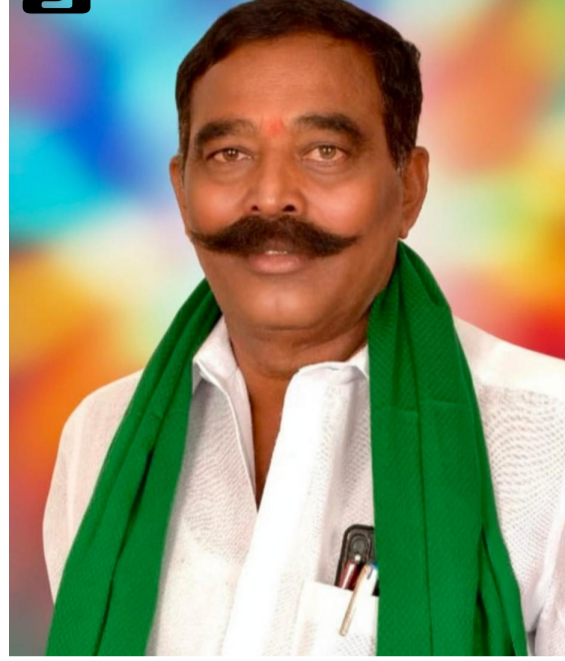
వ్యవసాయ రంగం మార్కెట్ గా మార్చాలి. లాభాల కోసం భూమిని పణంగా పెడుతున్నారు. వ్యవసాయం మన దేశ జీవన విధానం, కోట్ల మంది 65 శాతం ప్రజలకు వ్యవసాయం జీవనాధారం, కానీ షిడికెడు మంది కార్బన్ రేట్ కంట్రోల్ కోసం హైబ్రిడ్ విత్తనాలు ఎరువులు పురుగు మందులు విస్తృత