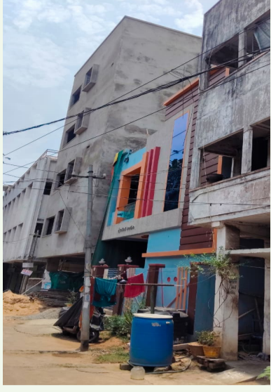
పోషిస్తున్నారు. ఇప్పటికైనా సంబంధిత అధికారులు స్పందించి అక్రమార్కులపై చర్యలు తీసుకోవాలని వలపులకు కోరుకుంటున్నాను.

(నేటి శుభోదయ : 27) విశాఖపట్నం జిల్లా గణపాక (టి.హెచ్.పి.వి) జీవీఎంసీ 68వ వార్డు డోర్ నెంబర్ 2-1-8 రాంసగర్ వసతిలో సచివాలయం కోడ్ : 457 అక్రమ నిర్మాణాలు... తెరచాటు దండా జీవీఎంసీ పట్టణ ప్రణాళిక నిబంధి, సచివాలయ కార్యదర్శులు అక్రమార్కులకు సహకరిస్తూ.. దాటవేత డోరణి అవలంబిస్తున్నారనే ఆరోపణలు వస్తున్నాయి. జీవీఎంసీ ఆదాయానికి గండి కొడుతూ... నిబంధనల ప్రకారం బహుళ అంతస్తుల సముదాయాలకు సెట్ బ్యాక్ విడివి పెట్టాలి. అదేవిధంగా అదనపు అంతస్తు నిర్మాణానికి జీవీఎంసీ నుంచి అనుమతులు తీసుకోవాలి. దీన్ని కోసం ప్రాంతాన్ని బట్టి రూ.15 లక్షలు వరకు జీవీఎంసీకి చెల్లించాల్సి ఉంటుంది. ఆ మొత్తం చెల్లించకుండా కొందరు భవన నిర్మాణ దారులు ఒక్కో భవనానికి మొట్ట మొత్తం అంతస్తుల అధికారులకు మొట్ట మొత్తంగానే అంతస్తులు ఉన్నాయి. ఈ అక్రమ వ్యవహారాలను క్షేత్రస్థాయిలోని కొందరు నిబంధి కీలకపాత్ర