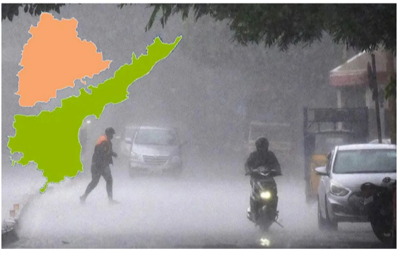
హైదరాబాద్/అమరావతి: తెలుగు రాష్ట్రాల్లో భూమిడి భగభగలతో అల్లడుతున్న ప్రజలకు వాతావరణ శాఖ ఉపశమనాన్ని కలిగించే వార్త చెప్పింది. మిగతా..2లో

ఉపరితల ద్రోణి.. కొన్ని రోజులుగా తెలుగు రాష్ట్రాల్లో నమోదవుతున్న గరిష్ట ఉష్ణోగ్రతలు ద్రోణి ప్రభావంతో మూడు రోజుల పాటు వర్షాలు పడతాయని వెల్లడించిన వాతావరణ శాఖ