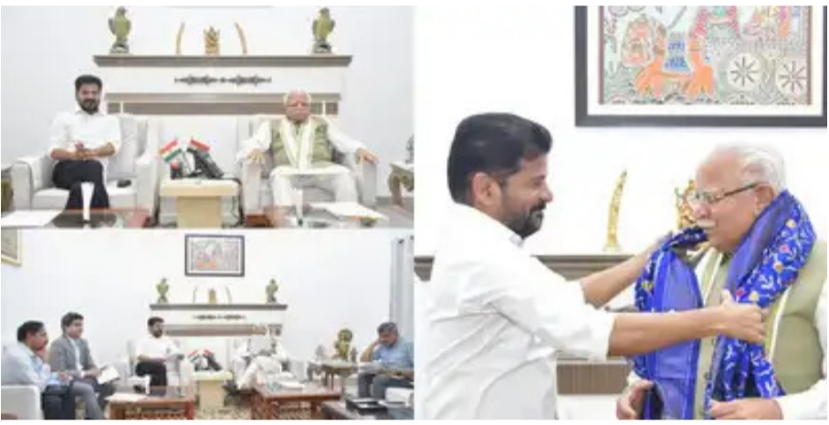
న్యూఢిల్లీ:తాజాగా జరిగిన ఐదు రాష్ట్రాల ఎన్నికల్లో భాగంగా కేరళలో ప్రధాని మోదీ, కేంద్ర హోంమంత్రి అమితాబ్ షాను ఓడించామని సీఎం రేవంత్ రెడ్డి వ్యాఖ్యానించారు. బుధవారం మధ్యాహ్నం ఢిల్లీకి వచ్చిన ఆయన విమానాశ్రయంలో విలేజరులు అడిగిన ఒక ప్రశ్నకు స్పందించారు. 'కేరళలో కాంగ్రెస్ విజయం సాధించింది. అక్కడ రాహుల్, ప్రియాంకా గాంధీ, మల్లికార్జున ఖర్సేలు నరేంద్ర మోదీ, మిగతా..2లో