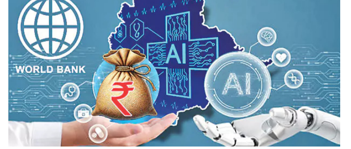
హైదరాబాద్: ప్రపంచబ్యాంకు రంగంలోనూ ఏవ ఆధారంగా అనేక అన్ని రంగాల్లో కృత్రిమ మేధ(ఏఐ) అవిష్కరణలు వస్తున్నాయి. ఈ క్రమంలో వినియోగం విస్తృతమవుతోంది. వైద్య రాష్ట్రానికి మంజూరు మిగతా..2లో

రాష్ట్రంలో ఏవతో చేపడుతున్న ప్రాజెక్టులపై డాక్యుమెంటేషన్.. ప్రపంచ బ్యాంకు రుణానికి ఏవ కీలకం! అంతరాతీయ సమావేశంలో వివరాల సమర్పణ