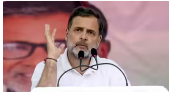
ఢిల్లీ: దేశం ఆర్థిక సంక్షోభాన్ని ఎదుర్కొంటున్న తరుణంలో ప్రధాని నరేంద్ర మోదీ విదేశాల్లో పర్యటిస్తున్నారని లోక్ సభ ప్రతిపక్ష నేత రాహుల్ గాంధీ విమర్శించారు. సొంత నియోజకవర్గమైన రామ్ బరేలీలో పర్యటించిన ఆయన చురువా హనుమాన్ ఆలయాన్ని సందర్శించిన సందర్భంగా మిగతా..2లో

మోదీ విధానాలపై రాహుల్ గాంధీ ఫైర్ మోదీ విదేశీ పర్యటనలపై విరుచుకుపడ్డ రాహుల్ గాంధీ దేశంపై పెద్ద ఆర్థిక తుపాను విరుచుకుపడుతుందని హెచ్చరిక ఆర్థిక సంక్షోభం సామాన్యులనే దెబ్బతీస్తుందని వ్యాఖ్య అదానీ, అంబానీలు, మోదీ ప్యాలెస్ లో సురక్షితంగా ఉంటారని విమర్శ