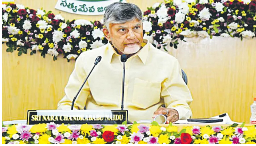
అమరావతి: గత ఐదేళ్ల పాటులో రాష్ట్రం అన్ని రంగాల్లో విధ్వంసానికి గురైందని, మత్స్య రంగం కూడా తీవ్రంగా దెబ్బతిందని చంద్రబాబు ఆరోపించారు. మిగతా..2లో

మత్స్య ఉత్పత్తులకు మార్కెటింగ్ మేనేజర్లా వ్యవహరిస్తానన్న సీఎం చంద్రబాబు వేట నిషేధ సమయంలో 1.30 లక్షల కుటుంబాలకు రూ. 262 కోట్ల ఆర్థిక సాయం మత్స్యకార మహిళల కోసం సీవీడీ సాగు, 60% సబ్సిడీపై 200 మెకనైజ్డ్ బోట్లు మన జిల్లాలో గస్తీ పెంచి ఇతర రాష్ట్రాల బోట్లను అడ్డుకుంటామని హామీ జాప్యబద్ధిన్న ఫిషింగ్ హార్వర్ నిర్మాణం. తీర గ్రామాలకు మెటల్ రోడ్ల ప్రకటన