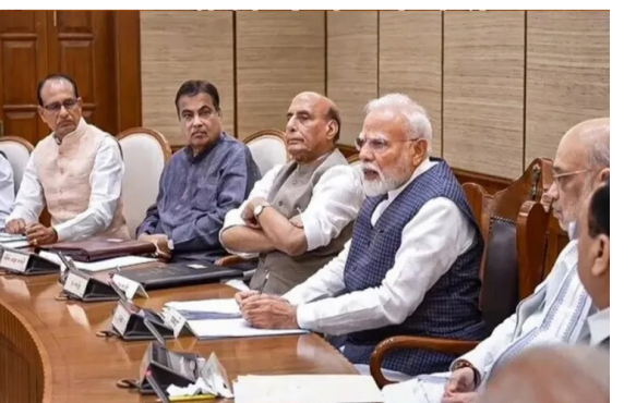
తెలుస్తోంది. కీలకమైన ఐదు రాష్ట్రాల ఎన్నికల ప్రక్రియ ముగియడంతో మంత్రివర్గ విస్తరణ తథ్యమంటూ ఢిల్లీలో రాజకీయ జోరందుకున్నాయి. వచ్చే ఏడాది వివిధ రాష్ట్రాల్లో జరిగే అసెంబ్లీ ఎన్నికలు, మిగతా..2లో

మంత్రివర్గ విస్తరణ తథ్యమంటూ ఢిల్లీలో రాజకీయ చర్చలు పార్లీతోపాటు ప్రభుత్వంలోనూ కొత్త సమీకరణాలకు బీజేపీ అభిప్రాయం తెరలేపే అవకాశం న్యూఢిల్లీ: దేశ రాజకీయాల్లో కీలక పరిణామాలకు అధికార బీజేపీ రంగం సిద్ధం చేస్తున్నట్లు