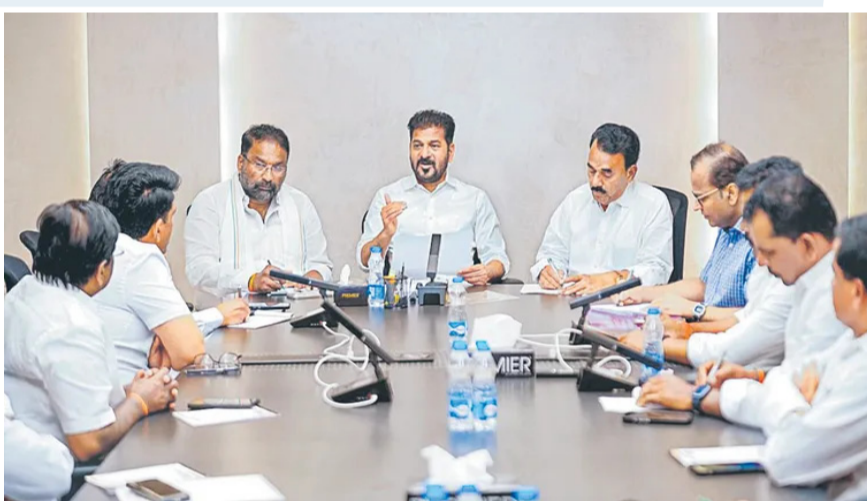
హైదరాబాద్: పాలమూరు--రంగారెడ్డి ప్రాజెక్టు భూసేకరణ ప్రక్రియను దగ్గరుండి యుద్ధప్రాతిపదికన పూర్తి చేయించాలని ఉమ్మడి మహబూబ్ నగర్ జిల్లా మంత్రులు, ప్రజాప్రతినిధులను సీఎం రేవంత్ రెడ్డి ఆదేశించారు. జిల్లాలోని ఇతర ప్రాజెక్టుల భూసేకరణనూ సాధ్యమైనంత త్వరగా పూర్తి చేయాలన్నారు. భూసేకరణలో జాప్యం జరగకుండా తక్షణమే బిల్లుల చెల్లింపులు మిగతా..2లో

'పాలమూరు'కు యుద్ధప్రాతిపదికన భూసేకరణ జిల్లాలోని ఇతర ప్రాజెక్టుల పెండింగ్ బిల్లులను చెల్లించడానికి ప్రభుత్వం సిద్ధంగా ఉంది భూసేకరణలో జాప్యం జరగకుండా తక్షణమే బిల్లుల చెల్లింపులు జరిగేలా చూస్తూం జూరాల పూడిక తొలగింపు