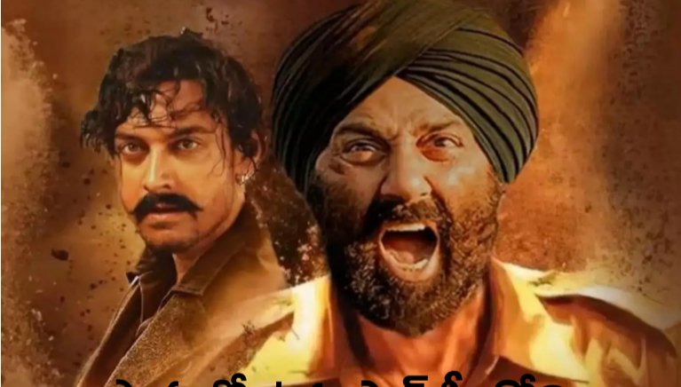
ప్లాపుల్లో ఉన్న స్టార్ హీరోని బయటపడేసే రియల్ హీరో ఇతడేనా?