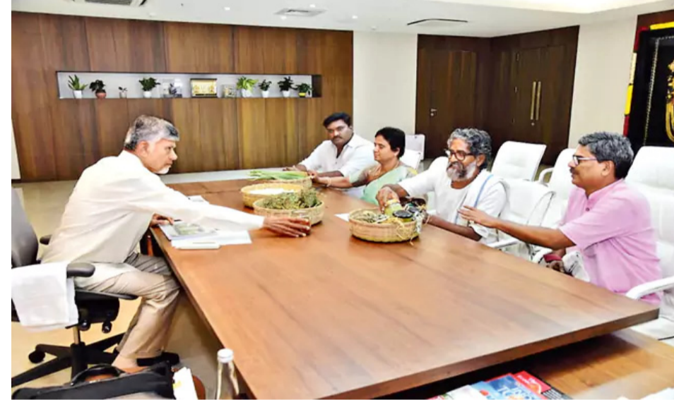
అమరావతి: "మన భూమి, మన పంట, మన వంటకు చేయూత ఇవ్వండి. రైతు సాస్టెబిల్ జాతీయ రహదారుల వెంట ఐదెకరాలు లీజుపై కేటాయించండి. అక్కడ 'తెలుగుదనం' పేరుతో 600 రకాల ఆంధ్ర వంటకాలను పరిచయం చేస్తాం. అవ్వవచ్చు, నానమ్మల చేతివంట రుచి చూపిస్తాం" మిగతా..2లో