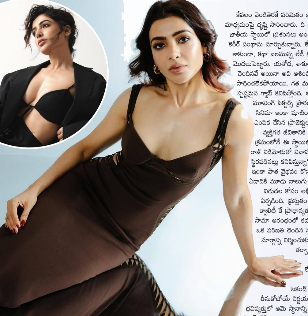
సినిమాలకు కొంతకాలం దూరం చేశాయి. మయోసైటిస్ వ్యాధి వల్ల శారీరకంగా, మానసిక నిర్దంగా బలపడటానికి ఆమె కావాలనే సినిమాలకు సుదీర్ఘ విరామం ప్రకటించిన సంగతి తెలిసిందే. అయితే సెకెండ్ ఇన్స్పిరింగ్ ప్రారంభించిన తర్వాత సమంత

ఏ మారు చేసినా అంటూ అడుగుపెట్టిన సమంత అనతి కాలంలోనే అగ్ర హీరోయిన్ గా ఎదిగారు. కెరీర్ అరంభంలో అమ్మడి ప్రయణం ఒక ప్రభంజనంలా సాగింది. మహేష్, పవన్ కళ్యాణ్, విశ్వేశర్ వంటి అగ్ర హీరోలవలె సరసన నడించి గోల్డెన్ లెగ్ గా పేరు తెచ్చుకున్నారు. తెలుగుతో పాటు తమిళంలోనూ పరుస విజయాలు సాధిస్తూ సౌత్ ఇండయాలోనే అత్యధిక పారితోషికం తీసుకునే కథానాయికలలో ఒకరిగా సత్తా చాటారు. ఆ సమయంలో ఆమె కెరీర్ గ్రాఫ్ నిరంతరం ఎదుగుతూనే ఉంది. అయితే వ్యక్తిగత జీవితంలో చోటుచేసుకున్న పరిణామాలు సమంత పుత్రికత్వం వేగాన్ని ప్రభావితం చేసాయి అన్నది కాదనలేని నిజం. వివాహం తర్వాత కూడా ఆమె-రంగస్థలం-, మజిలీ, ఓ టేబి వంటి చిత్రాలతో సలసలలోని వైవిధ్యాన్ని నిరూపించు కున్నారు. కానీ వైవాహిక జీవితంలో విడిపోవడం, ఆ తర్వాతి కాలంలో ఎదురైన ఆరోగ్య సమస్యలు ఆమెను