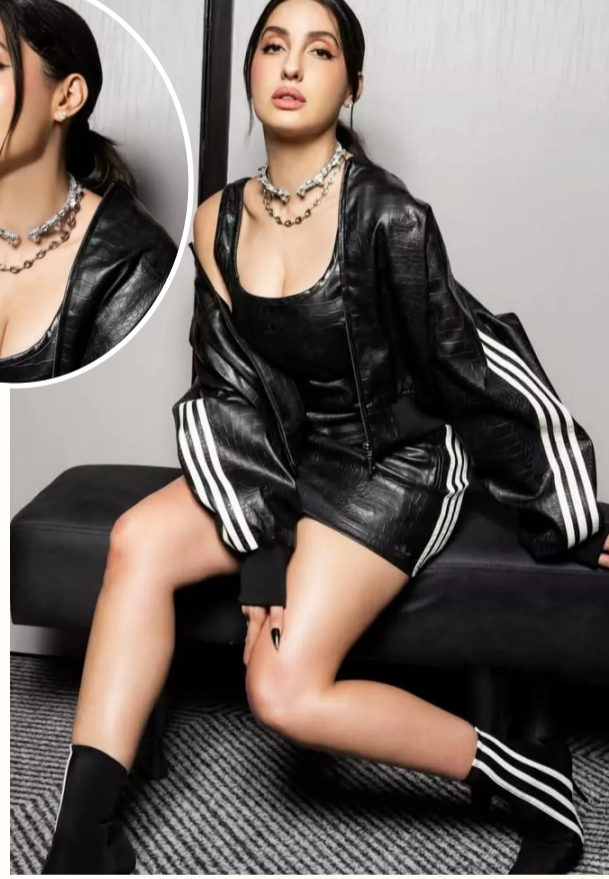
'X.జె.ఆర్.' ట్రాండ్ ను ఇష్టపడతారు. అలాగే, స్టైల్ టైటిల్ కోసం కేజర్ పరికరాలను కూడా ఉపయోగిస్తారని అంటుంటారు. ఇక ఆమె ఫిట్ నెస్ ట్రీక్ అని, రోజూ తనమైన వ్యాయామాలు చేస్తారని తెలుస్తోంది.

బాలీవుడ్ ద్వారా సెన్సేషన్ నోరా ఫతేహి తాజాగా సోషల్ మీడియాలో పేర్ చేసిన ఫోటోలు నెట్లంటు హల్లల్ చేస్తున్నాయి. తన అద్భుతమైన ద్వారా మూవీ తోనే కాకుండా, బోల్ట్ అండ్ గ్లామరస్ ఫ్యాషన్ సెన్సెతో కూడా నోరా ఎప్పుడూ చార్జ్ లో నిలుస్తుంటుంది. ఈసారి ట్విట్ కలర్ షెర్ట్ డ్రెస్సులో ఆమె ఇచ్చిన స్టైలిష్ పోజులు అభిమానులను ఫిదా చేస్తున్నాయి. ఆందానికే అందం అనేంతగా ఆమె ఈ ఫోటోల్లో మెరిసిపోతోంది. నోరా ఫతేహి తాజాగా పోస్ట్ చేసిన ఫోటోలు చూస్తుంటే, ఆమె అందం మనుషుల కంటే రెట్టింపు అయినట్లు అనిపిస్తోంది. ట్విట్ కలర్ డార్స్ షెర్ట్ డ్రెస్సులో ఆమె అత్యంత ఆకర్షణీయంగా కనిపించింది. ఆ డ్రెస్సుపై ఉన్న స్టైలిష్ జాకెట్, దానికి తగ్గట్టుగా మేకుప్ చేసే నెక్లెస్ ఆమె లుక్ ను మరింత ఎలివేట్ చేశాయి. కుర్చీపై కూర్చుని ఆమె ఇచ్చిన బోల్ట్ అండ్ గ్లామరస్ పోజులు కుర్రకారులను కట్టిపడేస్తున్నాయి. ఈ ఫోటోహాట్ ఇప్పుడు