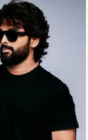
బజ్ నృష్టించిన రాకా, విడుదలకు ముందే ట్రెండ్ సెట్టర్ గా మారే సూచనలు కనిపిస్తున్నాయి. బన్నీ కొత్త లుక్, అట్లీ డైరెక్షన్, భారీ బడ్జెట్ అన్నీ కలిసి సినిమాను మోస్ట్ ఇంట్రిసింగ్ ప్రాజెక్ట్ గా మార్చుతున్నాయి.

కనిపిస్తోంది. ఇప్పటికే బన్నీ లుక్ సోషల్ మీడియాలో వైరల్ అవుతోంది. ముఖ్యంగా టీమిడియా క్రికెట్ హార్డిక్ పాండ్య.. సినిమాలోని సిగ్నీచర్ హ్యాండ్ జెస్చర్ ను రీక్రియేట్ చేయడం ముంత హైలైట్ గా మారింది. దీంతో ఫ్యాన్స్ లో సినిమాపై శ్రేణి మరింత పెరిగింది. ఇక నిర్మాణ పరంగా కూడా రాకా భారీ ప్రాజెక్ట్ గా రూపుదిద్దుకుంటోంది. ప్రముఖ నిర్మాణ సంస్థ సన్ పిక్చర్స్.. దాదాపు రూ. 800 కోట్ల బడ్జెట్ తో తెరకెక్కిస్తున్న ఆ సినిమా, భారతీయ సినీ చరిత్రలో అత్యంత కాస్ట్ చిత్రాల్లో ఒకటిగా నిలిచే అవకాశం ఉంది.. మొత్తానికి, టైటిల్ పోస్టర్ తోనే భారీ