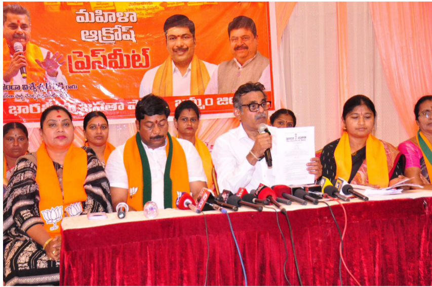
- రిజర్వేషన్లపై కాంగ్రెస్ చరిత్ర అంతా దుండ్రు వైఖరి

గణాంకాలతో పటాపంచలు నియోజకవర్గాల పునర్విభజన వల్ల దక్షిణ భారతదేశానికి అన్యాయం జరుగుతుందన్న విమర్శలను కొండా విశ్వేశ్వర్ రెడ్డి గణాంకాలతో తిప్పికొట్టారు. గత చరిత్రను ఉదహరిస్తూ, కాంగ్రెస్ హయాంలో జరిగిన పునర్విభజనల సమయంలోనే దక్షిణ భారత్ స్వీట్ కేటాయింపులో జీవంగా నష్టపోయిందని నిరూపించారు. 1963లో జరిగిన రెండవ పునర్విభజనలో ఉత్తర భారత్ కు 29 స్వీట్లు పెంచగా, దక్షిణ భారత్ కు కేవలం 2 స్వీట్లు (నికరంగా) మాత్రమే పెంచారని, ఆంధ్రప్రదేశ్ మరియు తమిళనాడులో స్వీట్ల తగ్గింపు జరిగిందని ఎత్తిచూపారు. ప్రస్తుత షోం మంత్రి అమిత్ షా పార్లమెంటులో చెప్పినట్లుగా ఏ ఒక్క రాష్ట్రానికి కూడా స్వీట్ల తగ్గింపు, పైగా దక్షిణాది రాష్ట్రాలకు 0.1 నుండి 0.2 శాతం వరకు అదనపు ప్రయోజనమే కలుగుతుందని భరోసా ఇచ్చారు. ఓటర్ల పెరుగుదలను గమనిస్తే, నియోజకవర్గాల సంఖ్య పెరగడం అనివార్యమని ఎంపీ పేర్కొన్నారు. 1971లో ప్రతి ఎంపీకి సగటున 10 లక్షల మంది ఓటర్లు ఉండేవారు. ఉత్తరప్రదేశ్ లో 10.03 లక్షలు, బీహార్ లో 10.03 లక్షల మంది ఓటర్లు ఉండేవారు. అయితే 2024 నాటికి ఈ సాంప్రద వివరణగా పెరిగింది. 2024 గణాంకాల ప్రకారం ఉత్తరప్రదేశ్ లో ప్రతి ఎంపీకి 19.30 లక్షల మంది, తెలంగాణలో 19.50 లక్షల మంది, ఆంధ్రప్రదేశ్ లో 16.60 లక్షల మంది ఓటర్లు ఉన్నారని వివరించారు. ఈ అధిక ఓటరు సాంద్రతను దృష్టిలో ఉంచుకుని పునర్విభజన చేపడతే, తెలంగాణలో ప్రస్తుతం ఉన్న 17 స్థానాలు 26 వరకు పెరిగే అవకాశం ఉందని విజ్ఞప్తించారు.